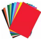
Cartulina de colores u hojas