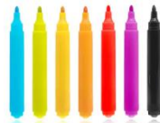
Plumones o lápices